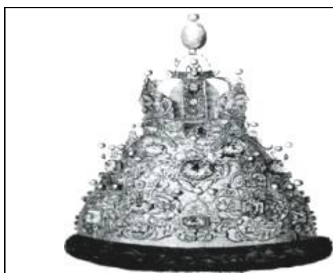
Рис. 1. Корона Астраханского царства

Астрахань основана в 1558 г., а как Центр Астраханской губернии с 1717 г. Представленный герб Высочайше утвержден императором Александром II 8 декабря 1856 г. (по старому стилю). «В лазоревом щите золотая, подобная королевской, корона с пятью дугами и зеленою подкладкой, под нею серебряный восточный меч с золотой рукоятью, острым концом вправо. Щит увенчан императорскою короною и окружен золотыми дубовыми листьями, соединенными Андреевскою лентой» [4] (рис. 2).